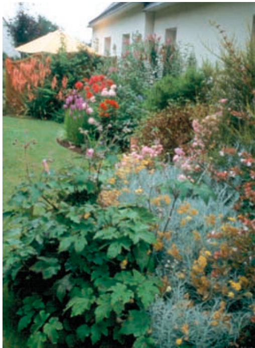
Plantations de couvre-sol