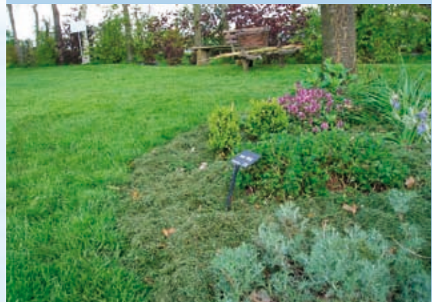
Paillage de tontes de gazon

Penser au paillage sur la terre nue, autour des vivaces ou des bulbes qui le transperceront.